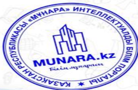
Главный редактор: Оразгалиевич Нұрлыбек